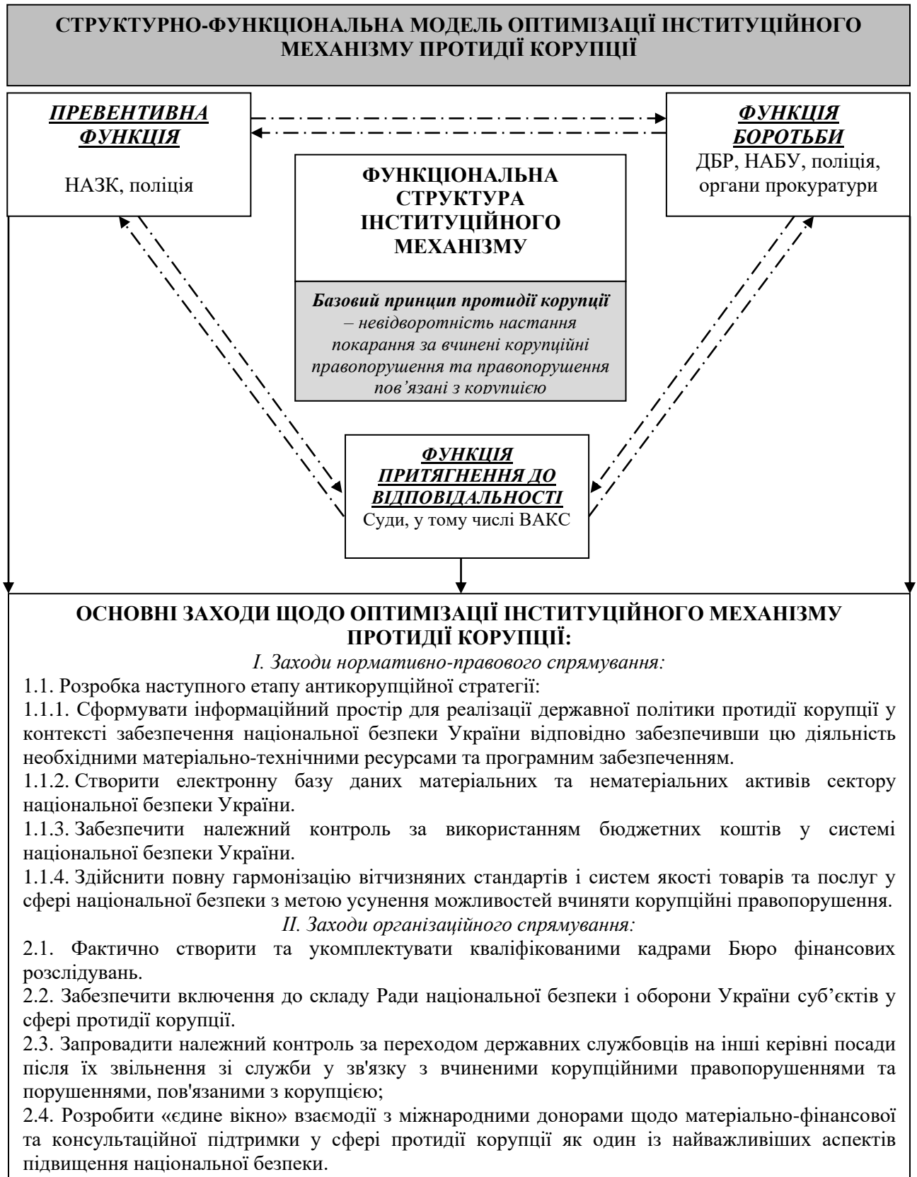
Рис. 1. Структурно-функціональна модель оптимізації інституційного механізму протидії корупції.

Запропоновано структурно-функціональну модель оптимізації інституційного механізму протидії корупції (див. рис. 1).