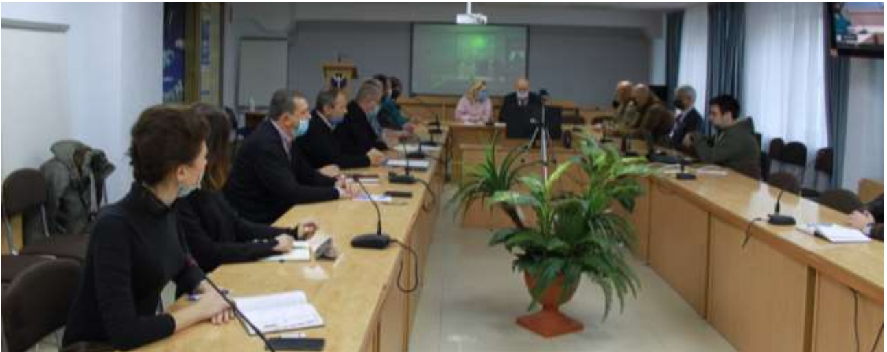
Учасниками Круглого стали у дистанційному режимі та очно стали 52 особи науковців, волонтерів, магістрантів та учасників бойових дій.