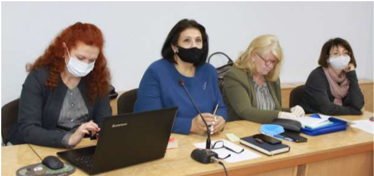
На Круглому столі панувала атмосфера розуміння проблематики соціально-психологічної адаптації УБД та ВПО.