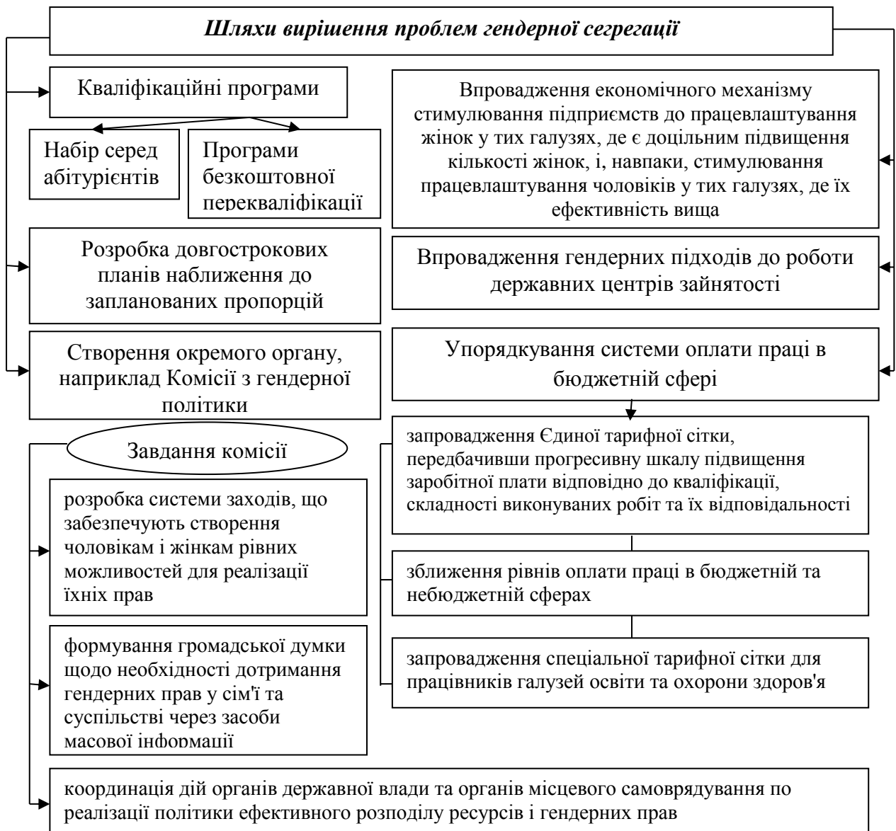
Рис. 4. Шляхи досягнення гендерного паритету