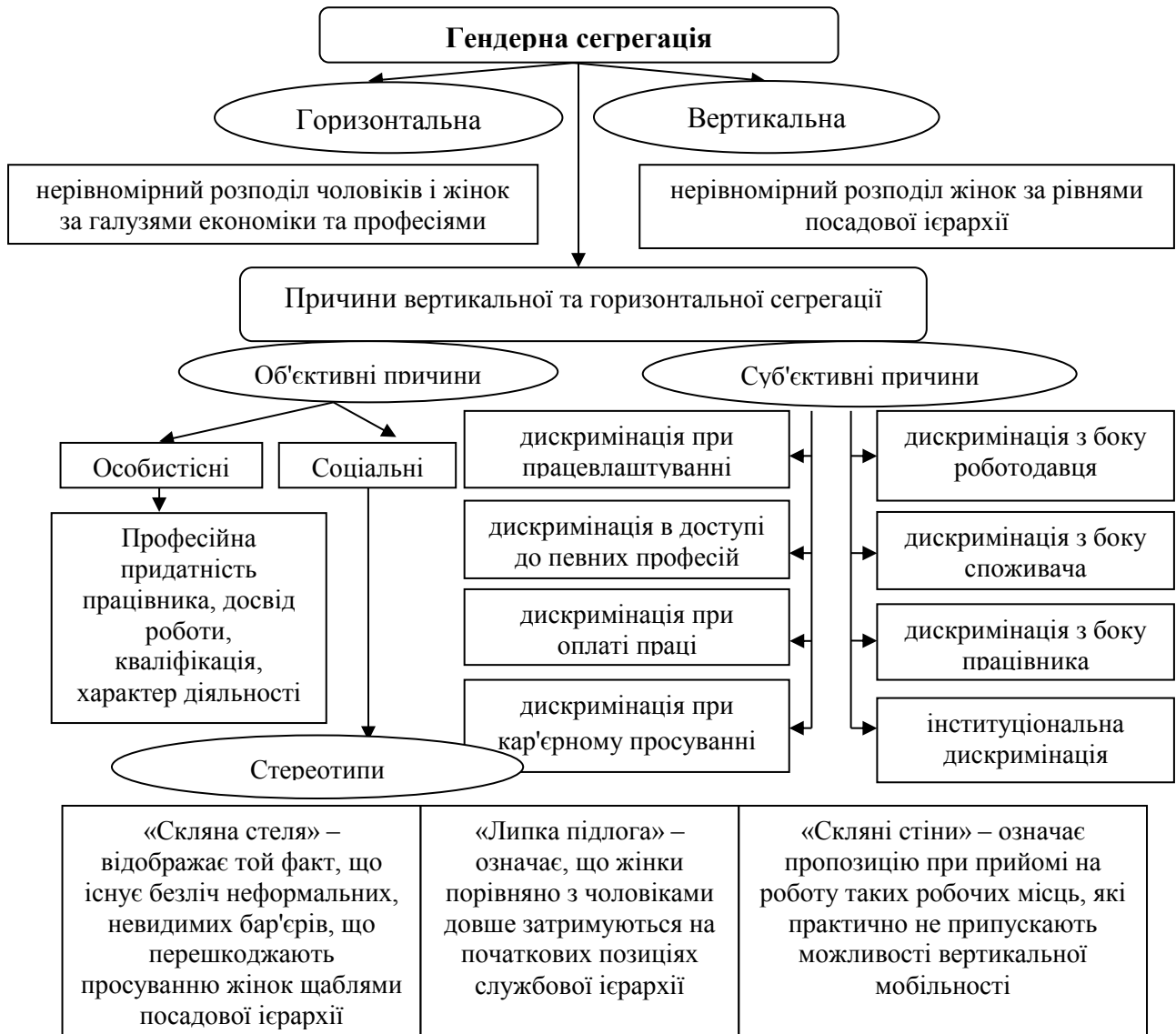
Рис. 1. Об'єктивні та суб'єктивні причини розподілу жінок і чоловіків у межах вертикальної та горизонтальної сегрегації

Досліджено питання гендерної сегрегації (рис. 1).