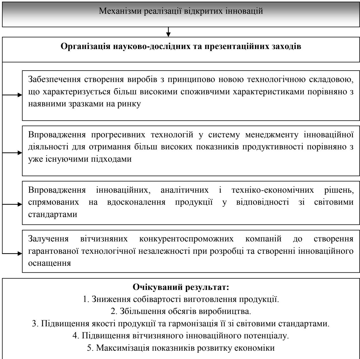
Рис. 1. Схема впровадження механізмів реалізації моделей відкритих інновацій як оптимізаційно-перспективна форма розвитку державно-приватного партнерства в інноваційній сфері України.

Упровадження моделей відкритих інновацій у стратегію розвитку наукоємного підприємства має забезпечити значне зростання якості продукції і збільшення прибутку від реалізації створених інноваційних зразків нової техніки (рис. 1).