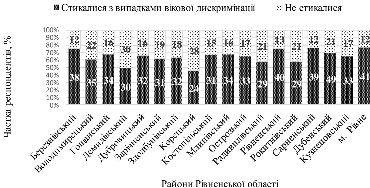
Рис. 2. Обсяги прояву вікових обмежень у зайнятості за результатами експертного опитування респондентів-безробітних віком 45–59 років, зареєстрованих у центрах зайнятості Рівненської області (осіб)

Для конкретизації чинників впливу на зайнятість населення старшого працездатного віку в 2015 р. автором спільно з фахівцями базових центрів зайнятості проведено експертне опитування населення старшого працездатного віку (940 безробітних і 394 роботодавців) у Рівненській області. За результатами опитування встановлено наявність суттєвих обсягів поширення утисків за ознакою віку (рис. 2) на всіх етапах реалізації трудових прав працездатним населенням віком 45–59 років (65 % респондентів-безробітних стикались з віковими обмеженнями під час працевлаштування, 58 % з опитаних респондентів – у процесі трудової діяльності, 21 % – ризикували бути першочергово звільненими). З-поміж усіх інших соціально-демографічних ознак вік є ключовим критерієм для роботодавців: 90 % опитаних роботодавців надають перевагу працівникам віком до 45 років; тільки 10 % роботодавців згодні працевлаштувати працівників у віці 45–59 років.