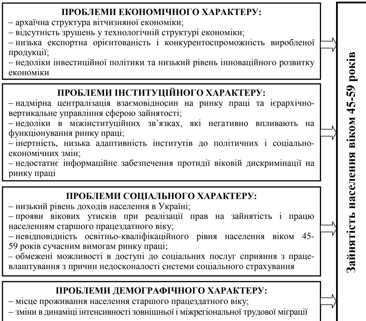
Рис. 3. Структурна схема базових блоків проблем, що визначають особливості зайнятості населення старшого працездатного віку в Україні

На основі проблем соціального виключення (ексклюзія) та включення (інклюзія), які згруповано у базові блоки (рис. 3), крізь призму вказаних концепцій ідентифіковано та науково обґрунтовано особливості зайнятості населення старшого працездатного віку в Україні.