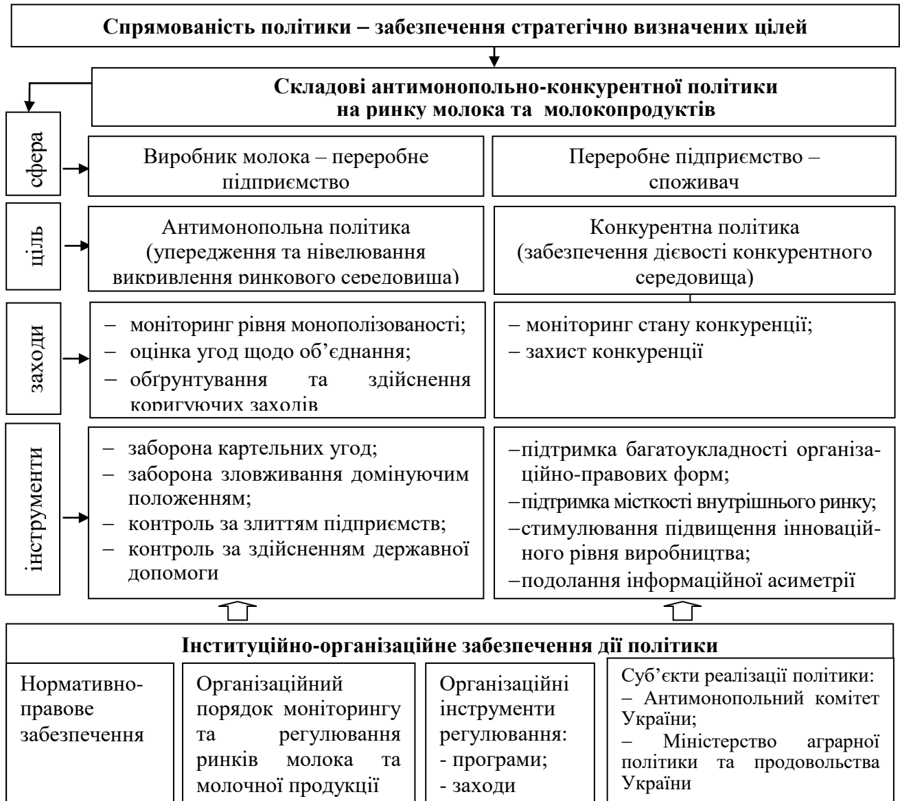
Рис. 1. Складові антимонопольно-конкурентної політики на ринку молока та молокопродуктів