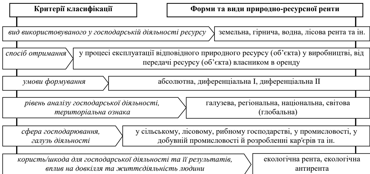
Рис. 1. Узагальнення критеріїв класифікації форм та видів природно-ресурсної ренти (доходів, що пов'язані з використанням природних ресурсів)

Природно-ресурсна рента виступає у формі доходу (рентного) від використання природних ресурсів та у формі плати (рентної) за користування ними.