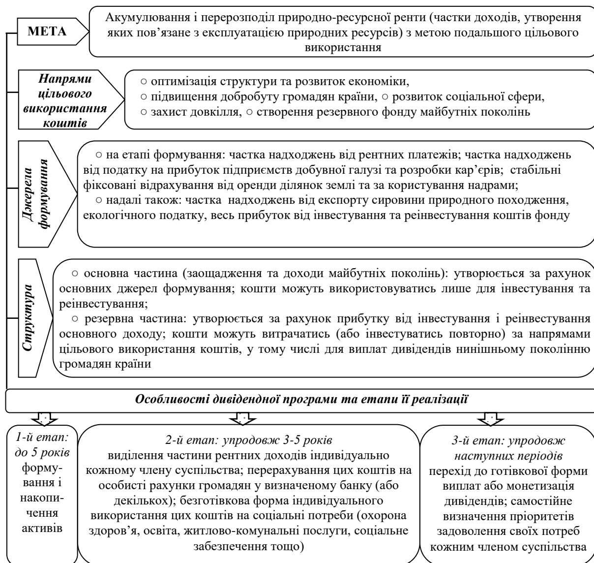
Рис. 3. Методичні положення формування рентного фонду в національній економіці