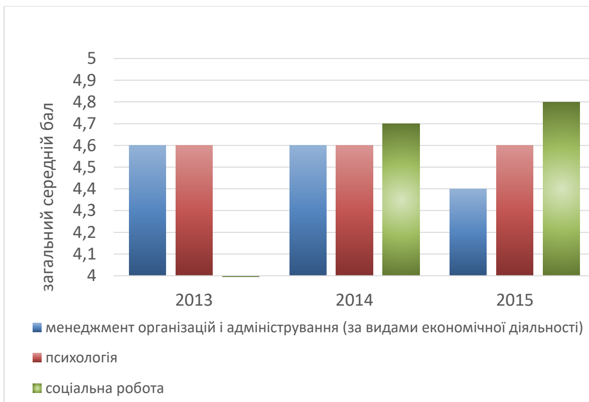
Рис. 2. Динаміка якісних параметрів атестації слухачів перепідготовки

Якісні параметри атестації випускників (рис. 2), свідчать про стабільно високі показники успішності слухачів перепідготовки, що підтверджує високий рівень їхньої мотивації до отримання другої вищої освіти.